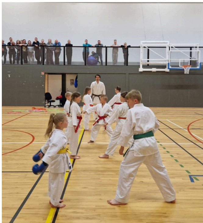
Karatesýning í máí.

Lífshlaupið var haldið í febrúar síðastliðinn og var þátttaka þokkaleg í Skaftárhreppi. Krakkarnir í Kirkjubæjarskóla voru í 7. sæti í sínum flokki og 60+ var í þriðja sæti yfir flestar mínútur og fimmta sæti með mestann fjölda daga.