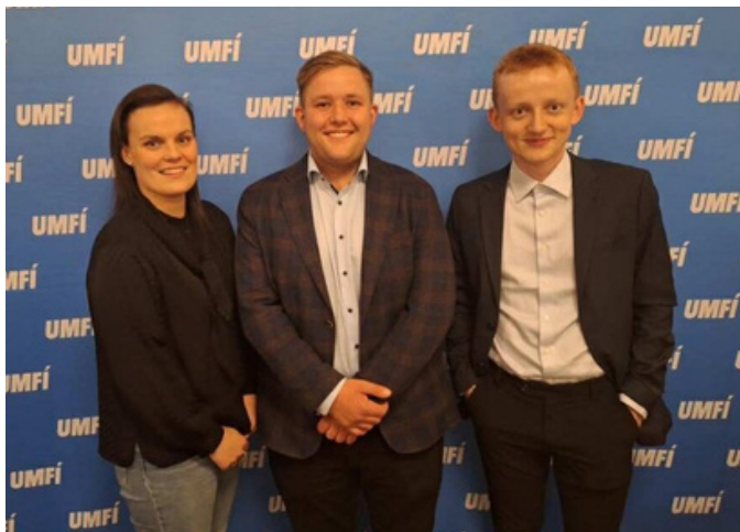
Fulltrúar USVS á sambandsþingi UMFÍ í Stykkishólmi.