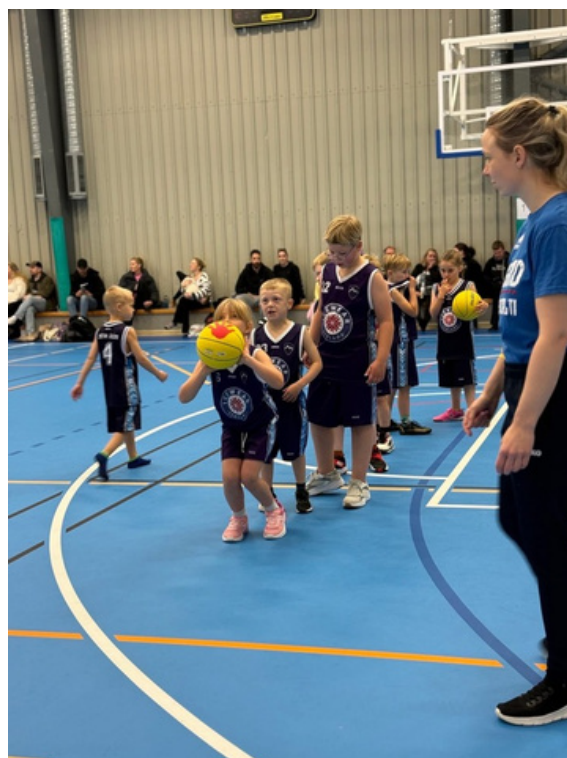
Hitað upp fyrir körfuboltamót í Vík.

Til að halda utan um skráningar, æfingagjöld og viðburði notar félagið skráningakerfið ABLER.