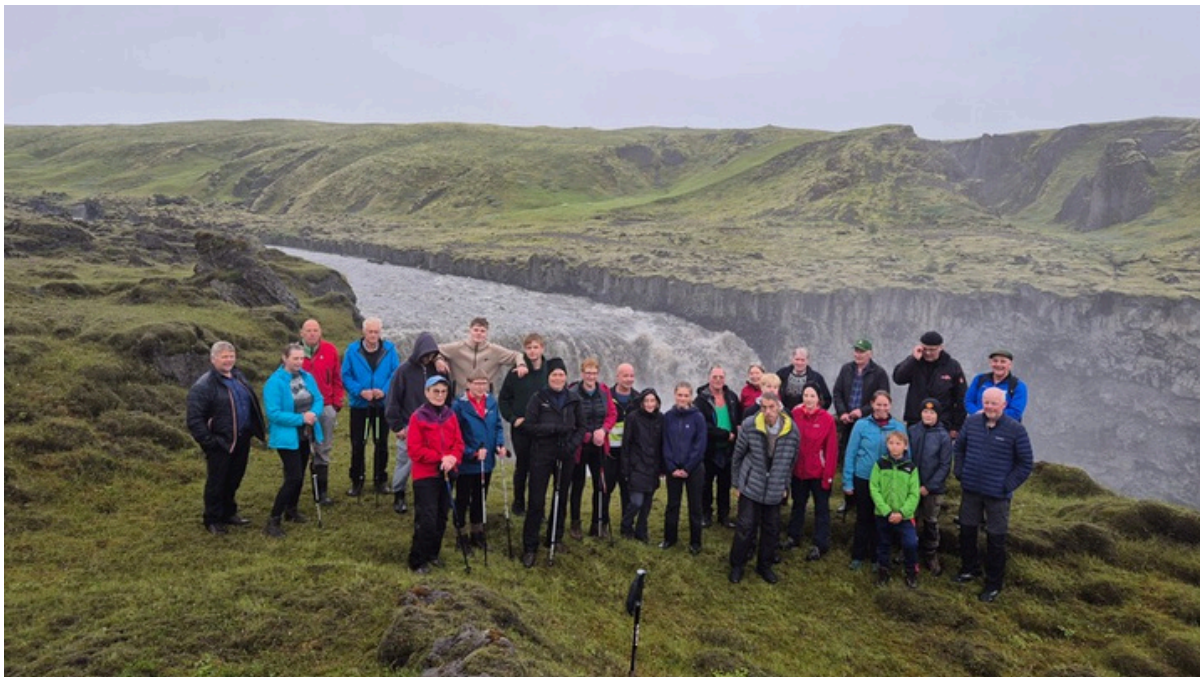
Frábær þátttaka var í göngum sumarsins.