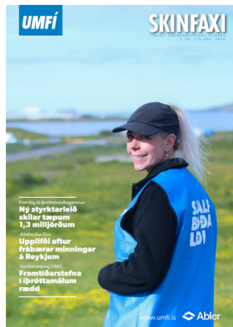
Blaðið Skinfaxi er alltaf stútfullt af áhugaverðu lesefni sem endurspeglar fjölbreytt starf UMFÍ um allt land.

UMFÍ veitir jafnframt styrki úr Umhverfissjóði. Árið 2025 voru veittir styrkir til fimmtán verkefna upp á 6,2 milljónir króna. Til samanburðar voru verkefni sex árið 2025 upp á 3,4 milljónir.