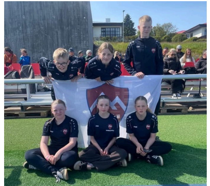
Flottir keppendur UMF Kötlu mætt á mót!