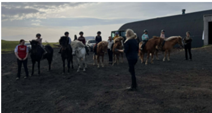
Reiðskóli Hmf. Kóps 2025.

Sameiginlegt Hestaþing Kóps og Sindra var haldið á Sindravelli við Pétursey þann 12.júlí. Þátttaka var góð og veðrið líka og má segja að mótið hafi heppnast mjög vel í alla staði. Að venju áttum við flotta fulltrúa á mótum síðasta sumars þ.m.t. Íslandsmóti, Reykjavíkurmeistaramóti, íþróttamóti Sleipnis, íþróttamóti Geysis og gæðingamótinu á Flúðum.