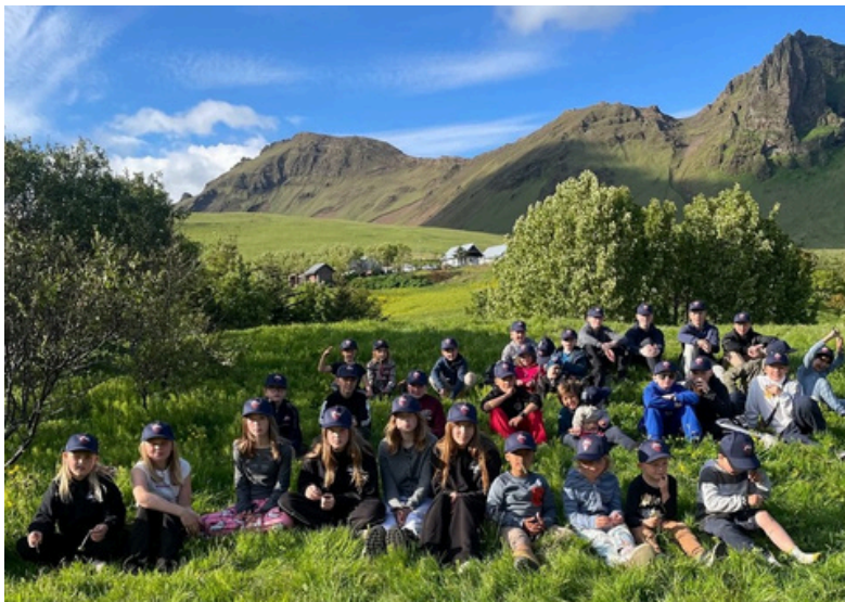
Allir fengu Kötlu derhúfur að gjöf.