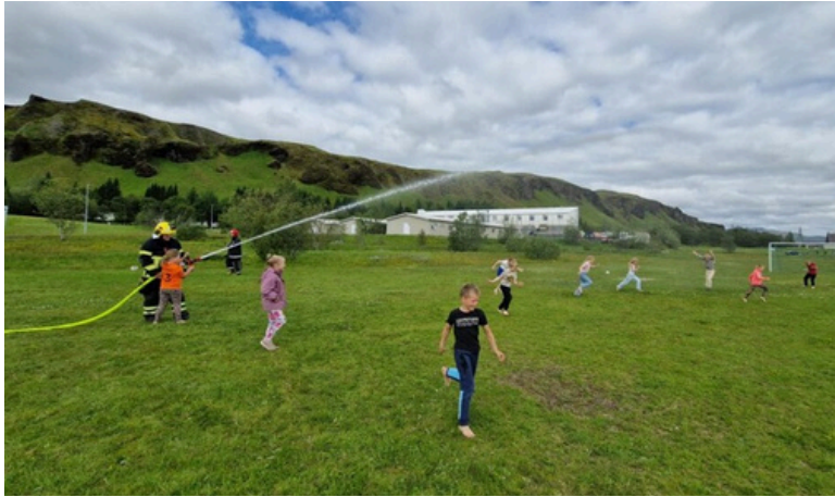
Slökkviliðið kom í heimsókn á leikjanámskeiðið.

Íþróttæfingar fyrir fullorðna hafa verið í boði bæði á haustönn 2025 og vorönn 2026. Það sem í boði er blak, fótbolti, körfubolti og ringó. Þátttaka er yfirleitt mjög vel viðunandi og er það von okkar að þessar æfingar eigi bara eftir eflast.