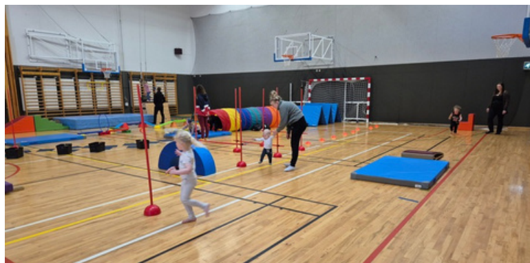
Alltaf fjölbreytt og skemmtileg verkefni í íþróttaskólanum.