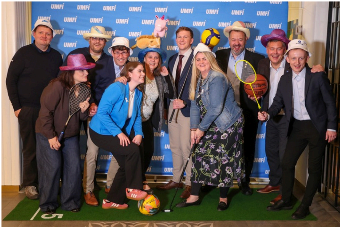
Ný stjórn UMFÍ í góðum gír.

Mikið var um að vera í starfi UMFÍ árið 2025. Áfram er unnið að því að auka samstarf í íþróttahreyfingunni, mikilvægar ákvarðanir voru teknar á þingi og stefnumótun ÍSÍ og UMFÍ var ýtt úr vör. Árið 2025 er árið sem öll íþróttahéruð urðu aðilar að UMFÍ þegar ÍBV bættist í hópinn og eru nú því öll 25 íþróttahéruð og þar með talin öll aðildarfélög aðilar að UMFÍ.