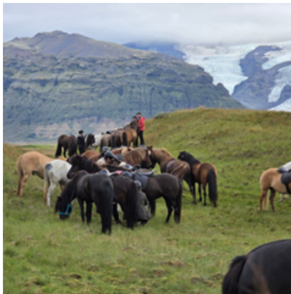
Mynd frá hestaferð Hmf. Kóps í Öraefin.