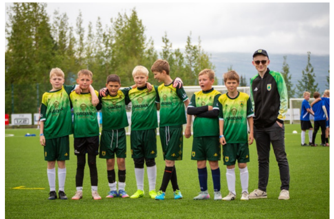
5. flokkur USVS í fótbolta á Unglingalandsmótinu ásamt þjálfara.