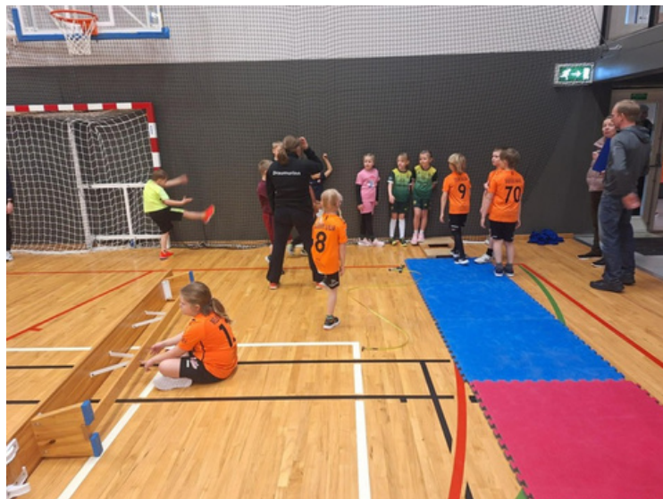
Frá innanhúsmóti í frjálsum íþróttum. Metþátttaka var á mótinu.