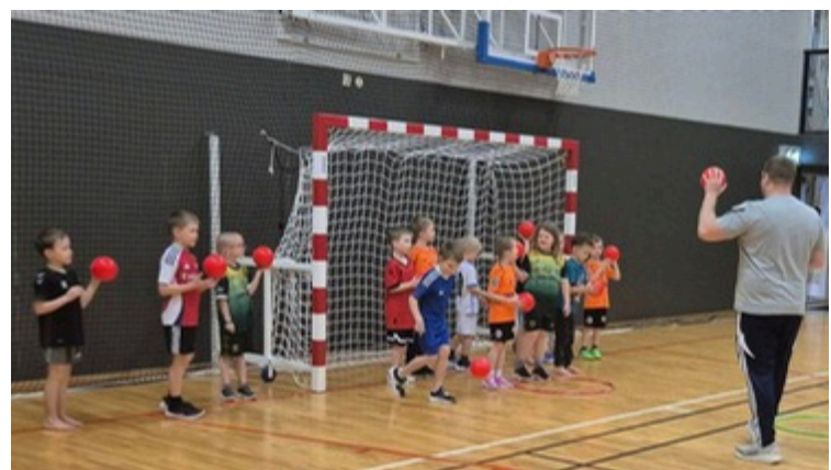
Líf og fjör á handboltanámskeiði.