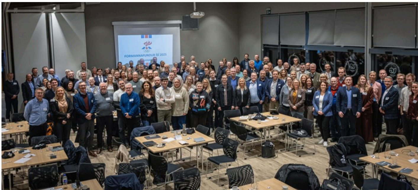
Frá formannafundi ÍSí sem haldinn var á Akranesi 21. nóvember síðastliðinn.