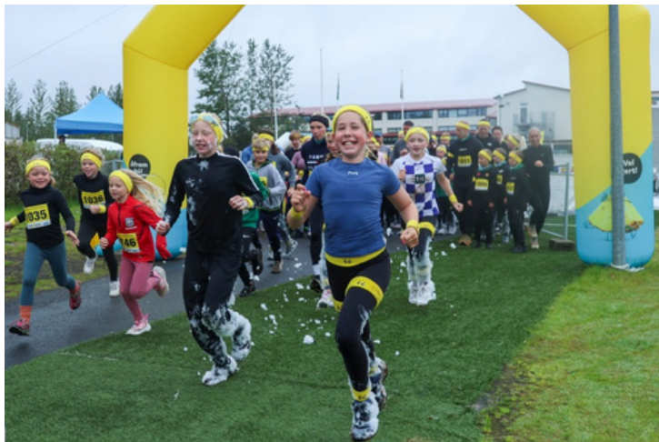
Hlaupið af stað í drulluhlaupi Krónunnar og UMFÍ.

Drulluhlaupið er samstarfsverkefni UMFÍ og Krónunnar. Það var haldið í fjórða sinn í Mosfellsbæ 16. ágúst 2025. Þátttakendum hefur fjölgað jafnt og þétt og voru þeir annað árið í röð yfir eitt þúsund. Það er um þreföldun frá fyrsta hlaupi. Hlaupalengdin er jafn löng og áður og með fjölda hindrana, sem var breytt að stórum hluta árið 2025.