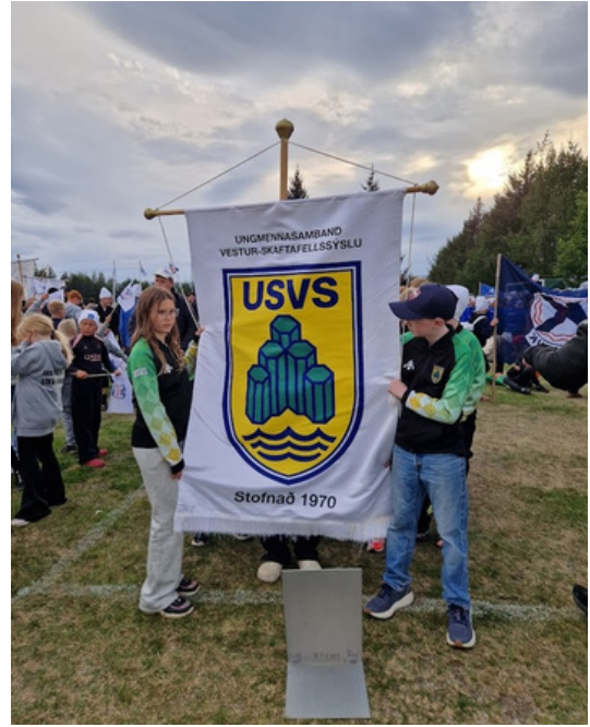
Mótssetning Unglingalandsmóts á Egilsstöðum