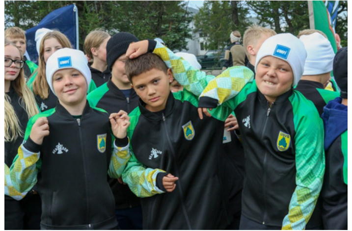
Keppendur USVS skemmtu sér vel eins og alltaf á Unglingalandsmóti.

USVS átti einnig tvo keppendur á Landsmóti UMFÍ 50+ sem fram fór í Fjallabyggð í lok júní 2025. Mótið í ár fer fram að Hrafnagili í Eyjafjarðarsveit dagana 26.-28. júní, og hvet ég okkar fólk til að kynna sér mótið.