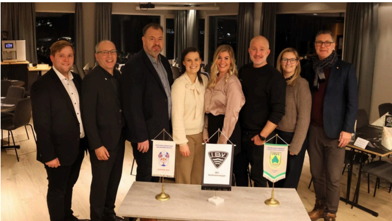
Fulltrúar USVS, HSK, ÍBV, ÍSÍ og UMFÍ auk svæðisfulltrúa á samráðsbundinum á Hellu.