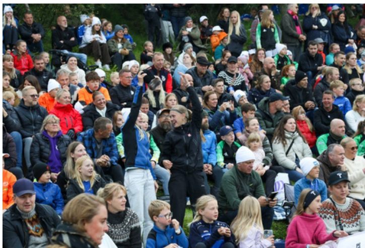
Líf og fjör í brekkunni á Unglingalandsmóti.

Húsnæði Skólabúðanna á Reykjum henta afar vel fyrir vinnustofur, fundi og ráðstefnur. Þar er gisting fyrir 120 manns og rými til funda í þremur stórum húsum, ípróttahús, sundlaug og gott útivistarsvæði. UMFÍ hvetur aðildarfélag sín til þess að nýta húsnæðið fyrir hópefli eða aðra viðburði á sínum vegum.