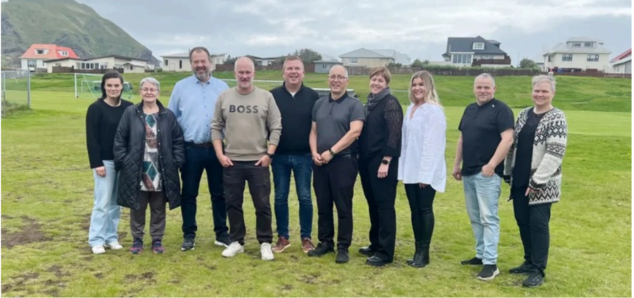
Fyrsti samráðsfundur stjórna íþróttahéraða á Suðurlandi var haldinn í Vestmannaeyjum.

Störf okkar svæðisfulltrúa hafa gengið prýðilega undanfarið ár. Tengslanetið hefur stækkað mikið og félagar innan hreyfingarinnar farnir að leita í auknum mæli til okkar.